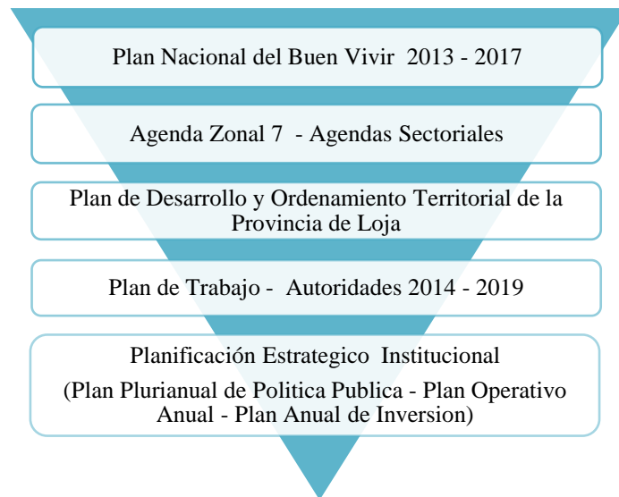
Gráfico 1 Alineación del Plan Estratégico Institucional 2015 - 2019

Elaboración: Coordinación de Gobernabilidad, Planificación y Desarrollo Territorial, Gobierno Provincial de Loja