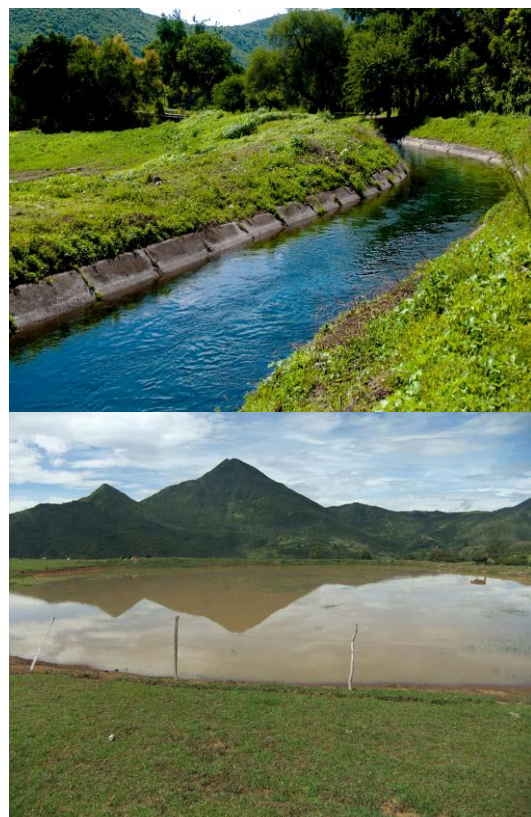
Foto: Superior.- Calvas Inferior.- albarrada

La Constitución de la República establece que entre las competencias del Gobierno provincial constan: ejecutar obras en cuencas y microcuencas y realizar la gestión ambiental provincial.