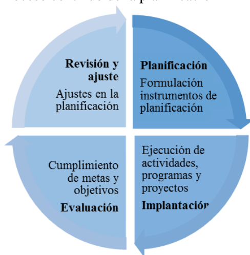
Gráfico 4 Proceso continuo de la planificación

Elaboración: Coordinación de Gobernabilidad, Planificación y Desarrollo Territorial, Gobierno Provincial de Loja.