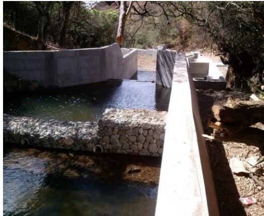
Foto: Canal de Riego San Pedro

El desarrollo y crecimiento del sector productivo requiere el apoyo del Estado, a través de una adecuada infraestructura para el sector agropecuario y minero. La construcción de canales de riego, vías de comunicación y dotación de maquinaria y equipamiento tecnológico serán una preocupación constante dentro de la gestión pública; así como la generación de plazas de trabajo, creando empresas productivas.