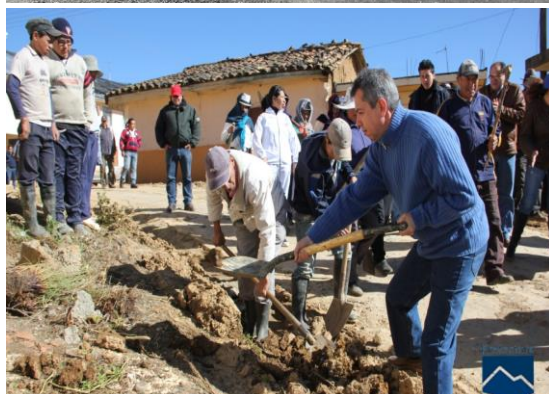
Foto: Superior.- Vía Saraguro Tenta Inferior.- Minga de limpieza Vía Villonaco - Chuquiribamba

La provincia de Loja requiere la rehabilitación urgente de sus vías y carreteras que posibiliten una mejor conectividad con el resto del país. La