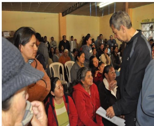
Foto: Reunión Casa Comunal de la Cdla. Víctor Emilio Valdivieso

El Plan de Desarrollo constituye una valiosa herramienta o instrumento de gestión, resultado inicial y principal de la aplicación de un esquema de planificación, este presenta el programa de gobierno y se conjuga la acción coordinada de la planeación con los órdenes de gobierno nacional, regional y local. En éste se definen también los propósitos y estrategias de desarrollo territorial y se establecen las líneas de acción así como los programas y proyectos que el gobierno local tomará para elaborar sus programas operativos anuales.