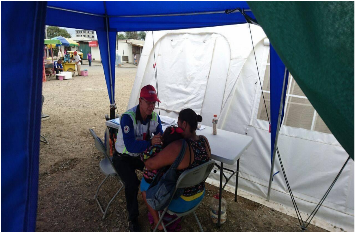
Fotografía 3: Atención Primaria en Salud -Equipo de Respuesta a Emergencias – Pedernales