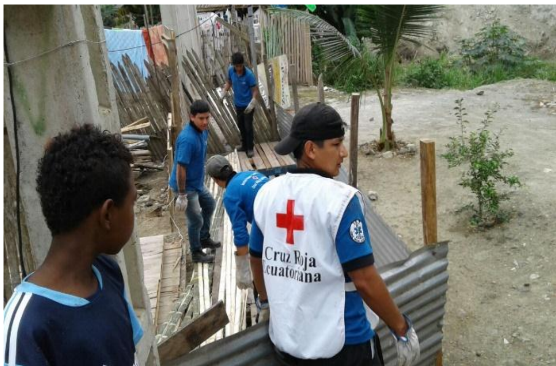
Fotografía en Entrega de kit Shelter - Pedernales.