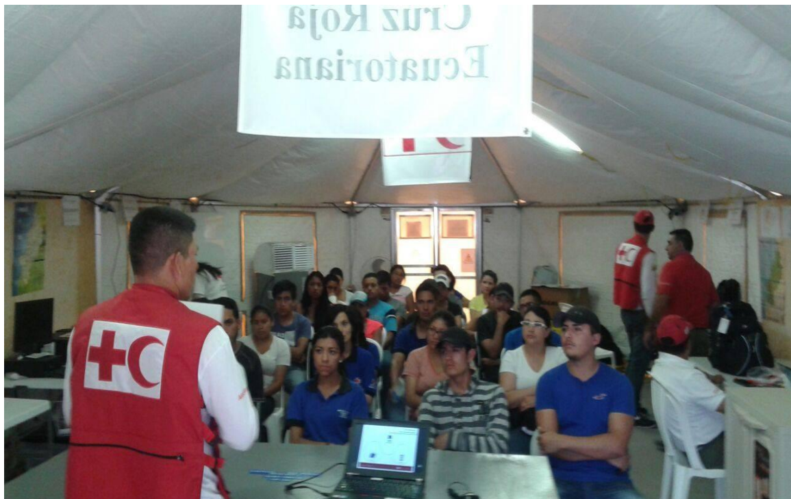
Fotografía 8. Taller ODK, MEGA V, distribución y logística- Campamento Manta.