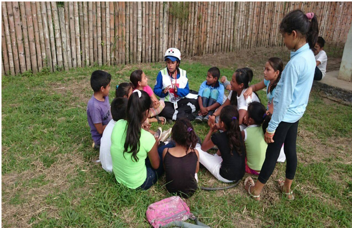
Fotografía 4: Trabajo Brigada de Salud Comunidad 10 de Agosto – Pedernales