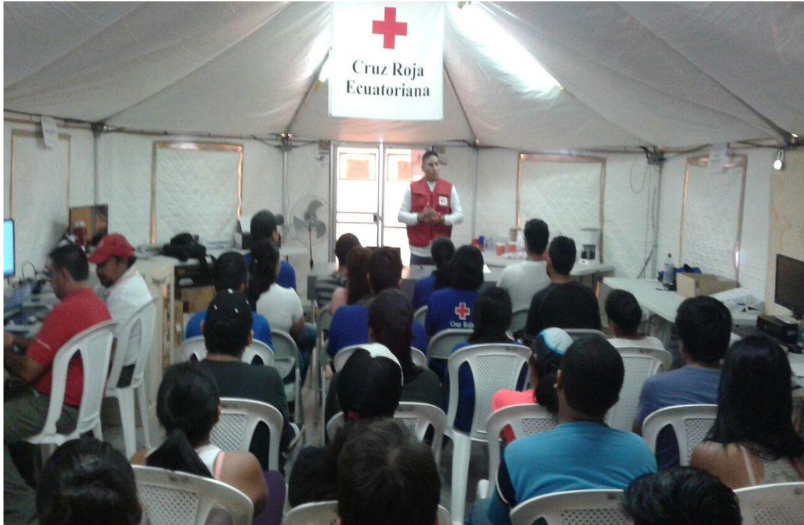
Fotografía 7. Taller ODK, MEGA V, distribución y logística- Campamento Manta