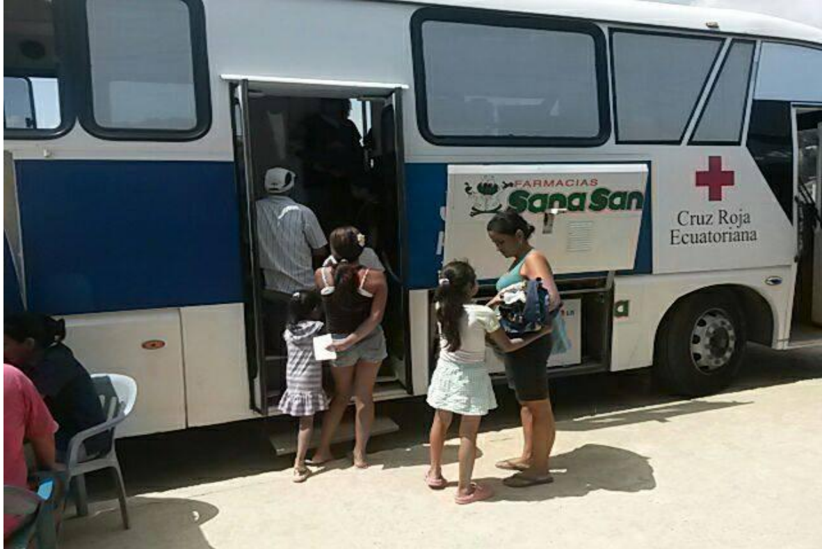
Fotografía 5. Atención Primaria en Salud- Sucre