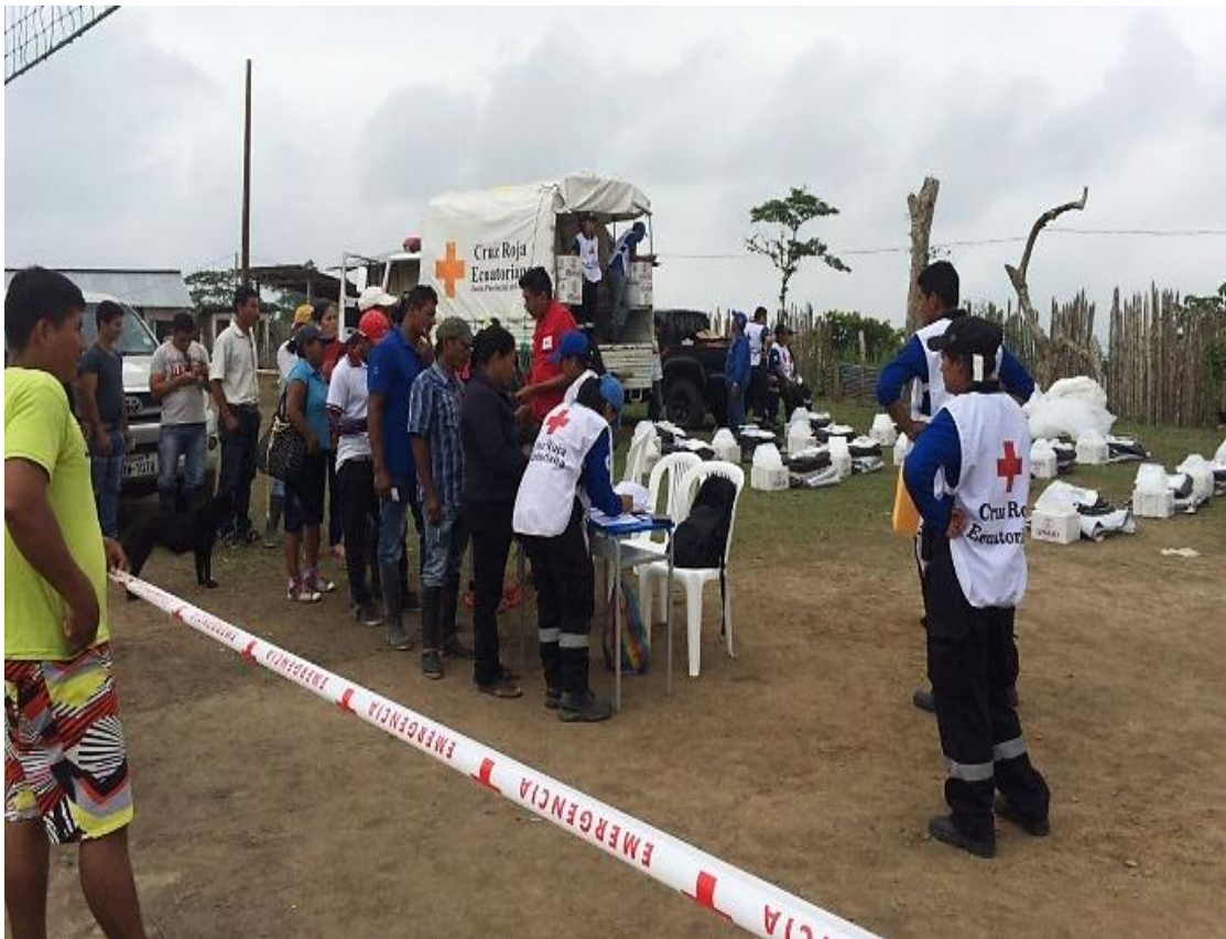
Fotografía1. Distribución de Asistencia Humanitaria- Pedernales- Atahualpa