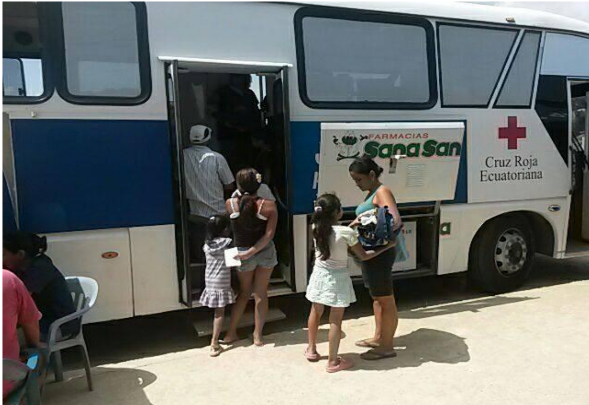
Fotografía 5. Atención Primaria en Salud- Sucre